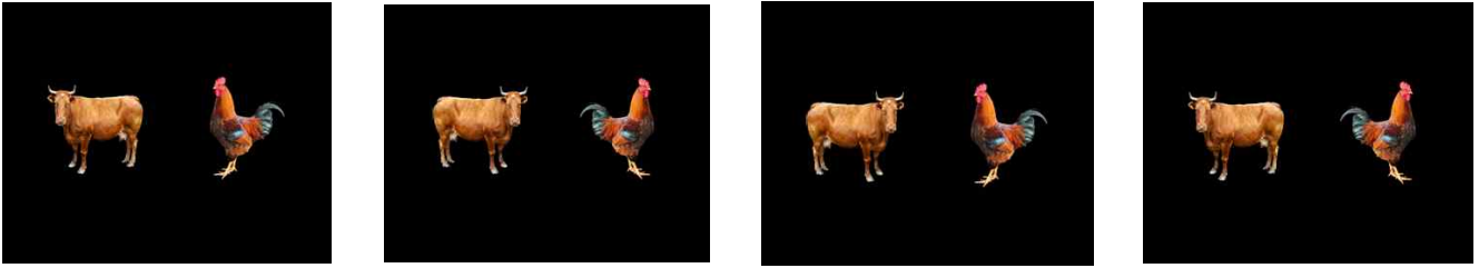
Figure 1. Four confrontation types of two photographic stimuli in the task.

였다. 자극을 선정하는 예비과정에서 한글 사용자가 자극의 의미적 크기를 보편적으로 확실히 알고 있는 동물을 사용했다. 또한, 선정된 동물들의 의미적 크기 위계에 실험 참가자가 동의하고 있는지 확인하기 위하여, 실험을 시작하기 전, 참가자에게 무작위로 순서로 제시된 동물 단어를 보여주고, 동물 단어를 의미적 크기에 따라 가장 작은 동물부터 큰 동물까지 순서대로 작성하도록 했다. 이를 통해 참가자 모두 Table 1과 일치한 의미적 크기 위계를 갖고 있음을 확인하였다.